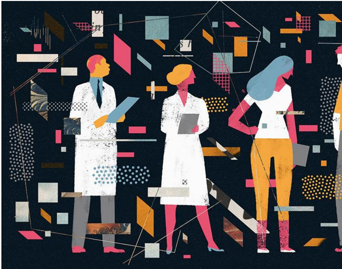
Ilustración: Keith Negley